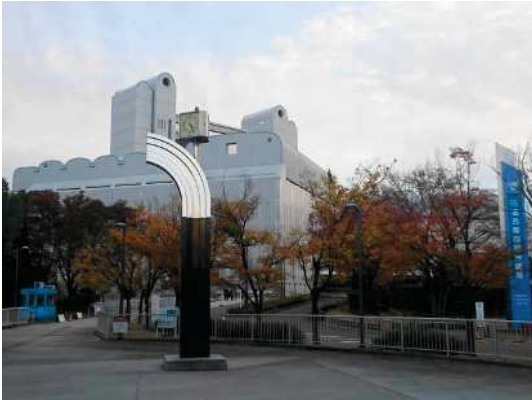
会場となった名古屋国際会議場