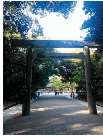
会場近くの熱田神宮で必勝祈願

11月22日(木)「名古屋国際会議場(愛知県名古屋市)」において、第57回電話応対コンクール全国大会 in 名古屋が開催され、全国10,903名の参加者の中から予選を勝ち上がった57名の選手が出場しました。