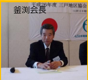
平成26年度 三戸地区協会 釜淵会長