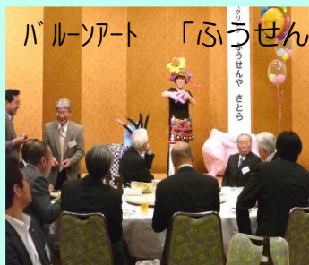
バルーンアート「ふうせんやさとら」