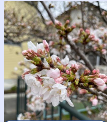
近くの公園の桜が咲きました。 毎年愉しませて頂いています。 桜みているとウキウキした気分になるから不思議です。