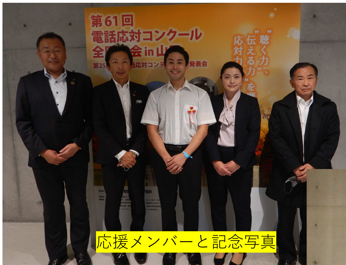
応援メンバーと記念写真