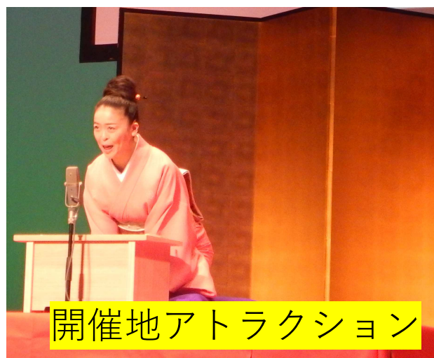
開催地アトラクション