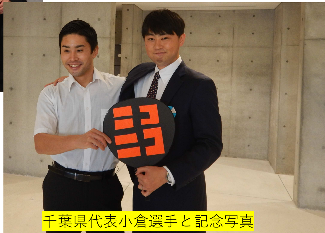
千葉県代表小倉選手と記念写真