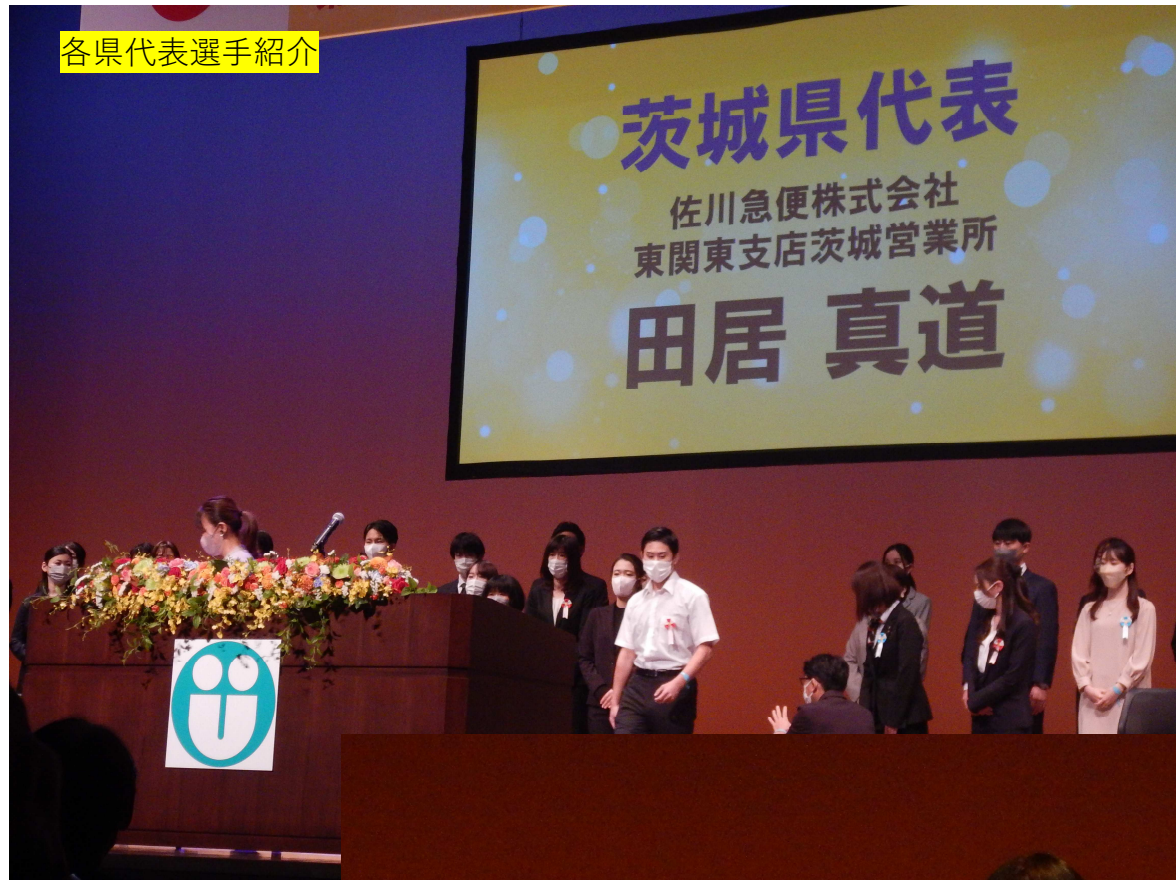
各県代表選手紹介