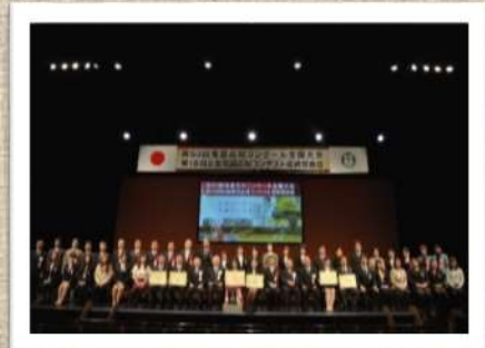
～表彰式（受賞者記念撮影）～