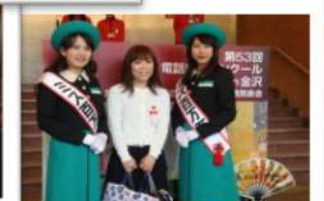
～競技終了後ロビーにて～