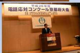
山下本部長開会あいさつ