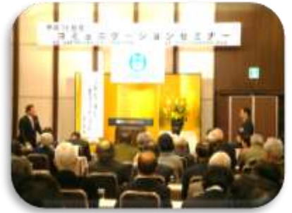
参加者とキャッチボール