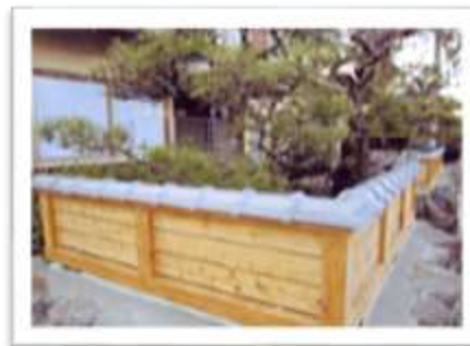
こだわりの屋根工事専門