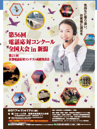
■平成29年度電話応対コンクール開催予定