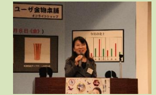
玉本審査委員長 審査講評