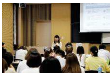
事前対策セミナー(京都)