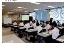
事前対策セミナー(北京都)