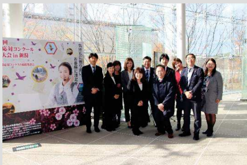
競技終了後、応援の方々