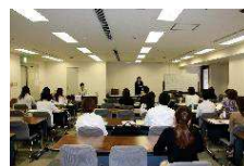
スキルアップ実践研修