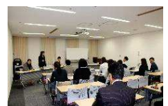
3支部合同ステップアップ研修