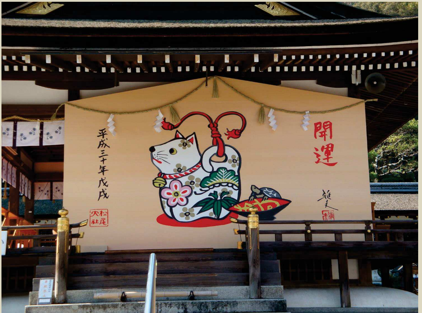
松尾大社絵馬 (京都市)

公益財団法人日本電信電話ユーザ協会 京都支部、京都協会、北京都協会 役員・事務局一同