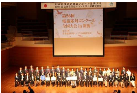
平成29年度 全国大会 （新潟市）