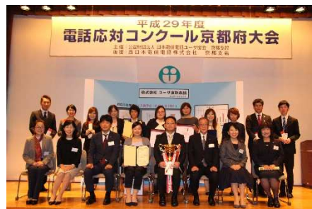
平成29年度 京都府大会