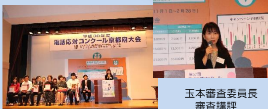
玉本審査委員長 審査講評