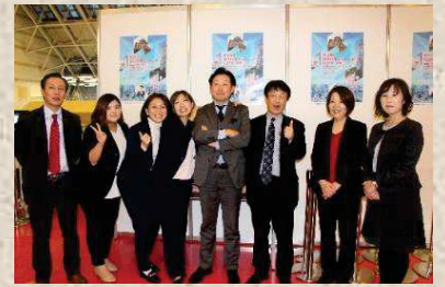
競技終了後、応援の方々