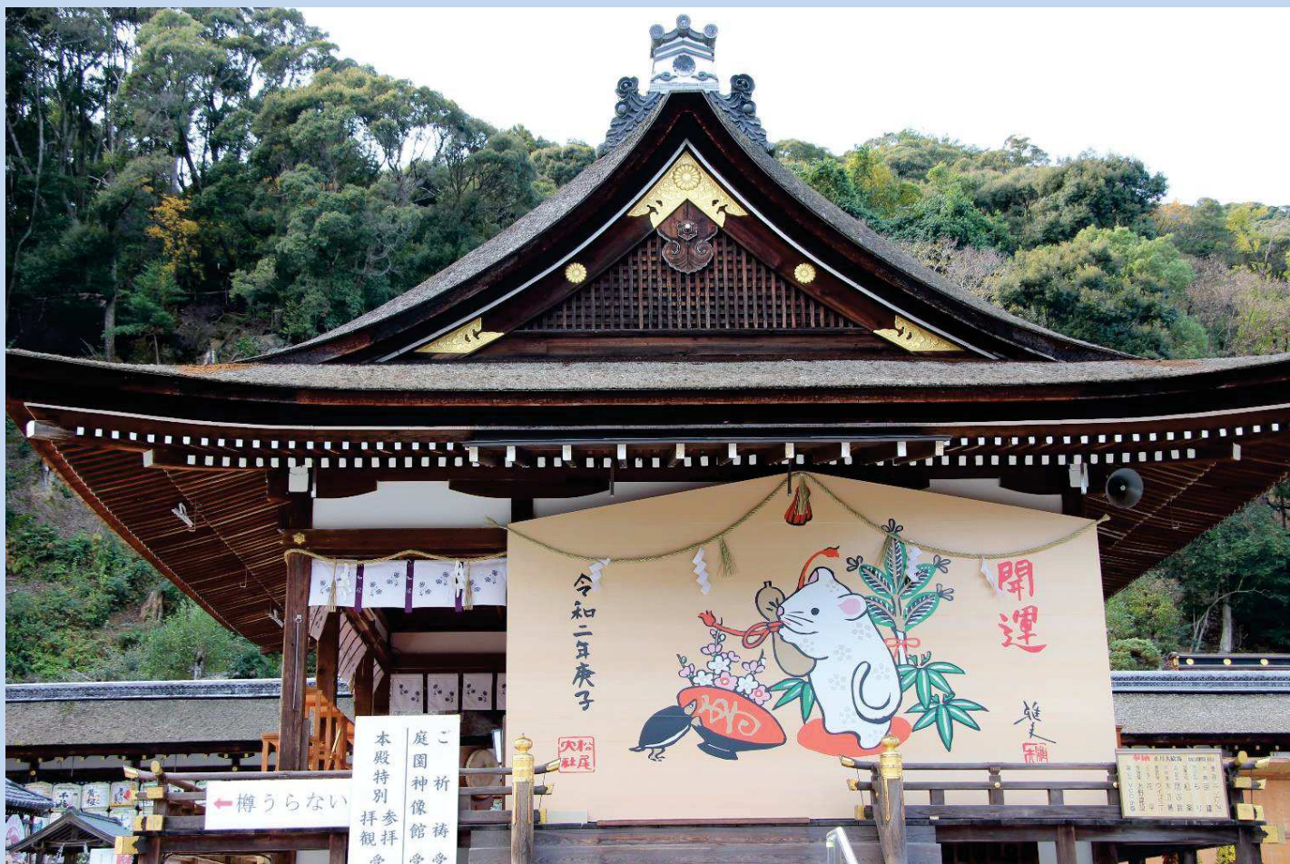
松尾大社絵馬 (京都市)