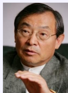
(株)ビジネス・ブレイクスルー 代表取締役会長 大前 研一氏

https://coubic.com/jtua-kinki/638169#pageContent