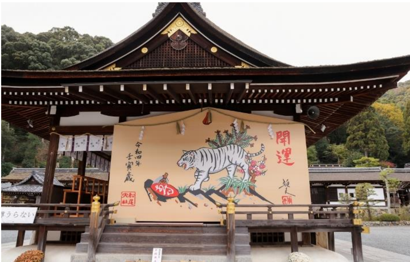
松尾大社絵馬 (京都市)