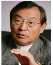
(株)ビジネス・ブレイクスルー 代表取締役会長 大前研一氏