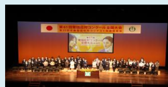
昨年の全国大会の様様