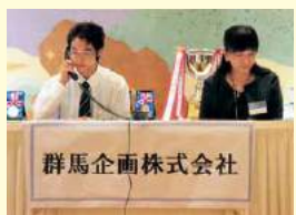
群馬企画株式会社

上越テクノスクールは「人材養成」、「再就職支援」、「学習企業支援」を総合的に実施し、上越地域の産業を支える人材育成を図ることを目的に、昭和21年に設立されました。 上越地域の産業に関連した訓練コースを設置し、「人材養成」としては、主に新規卒業者を対象に、職業に必要な基礎的な知識、技能を習得させ、若年技能労働者を育成しています。現在ビジネススタッフ科、自動車整備科、メカトロニクス科が設置されています。「再就職支援」では求職者を対象に再就職に必要な基礎的な知識、技能を習得させ再就職を促進しています。「学習企業支援」としては事業主が自ら従