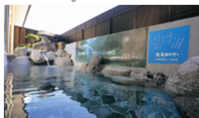
温泉 / 自家源泉が湧出する温泉。大浴場、露天風呂を備え、飲泉泉もある

温泉事業を継続させながら、近年では画期的な取り組みにも挑戦されています。湯治療養に本格的に力を入れ、「健康長寿の宿」をコンセプトに2019年リニューアルオープンしました。最近では、大人数で宴会をする場が減少しているなか、思い切った宴会用だった大広間をリノベーションして、ジム機器を揃えたフィットネスルームを造りました。新型コロナウイルスの感染が拡大する前に、設備投資ができたのが大きかったですね。