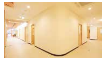
広々として清潔感ある廊下

西澤病院では、地域医療と介護を一体化し、住み慣れた地域で一人ひとりが自分らしくいられるケアを目的としています。脳血管障がい、神経難病や癌の終末期などにより重度の介護が必要になった高齢者の皆さまに寄り添い、高度な医療サポートを提供しています。現在、108床の療養室を備えており、長野県有数の設備を誇っています。