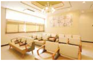
ゆったりとした待合室