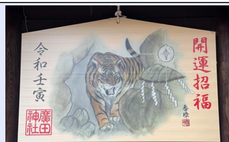
西宮廣田神社の今年の絵馬です。 毎年立派な絵馬が奉納されます。

どうぞ今年も当協会の活動へのご理解ご協力のほど、よろしく申し上げます。今年こそは新型コロナが収束し、皆様の会社が益々繁栄、そして世の中が平穏で素敵な1年でありますように祈念します。今年も「U協近畿通心」愉しんで頂けると幸いです。