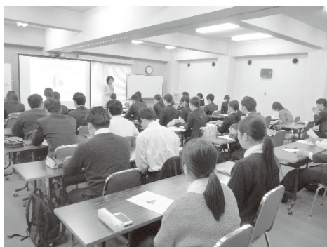
【奈良会場 研修風景】

前年度同様に「1日コース」「半日コース」と企業様の実情に応じ選択できるようにし、各会場とも定員を超える参加申込みがありました。