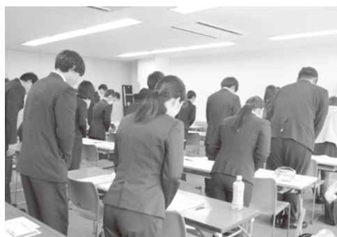
【生駒会場 研修風景】

参加者の皆様、お疲れ様でした、送り出していたいただいた企業の皆様、ありがとうございました。