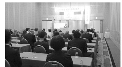
熱心に聞き入る会員の皆様

この夏の参議院議員選挙を控え、一強他弱の安倍政権が抱える問題・課題について、テレビ・ラジオでは聞けない話に、参加者は熱心に耳を傾け、あっという間の90分でした。