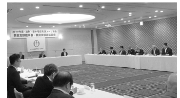
議案審議中の理事・評議員の皆様