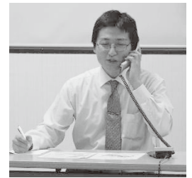
研修の成果を披露