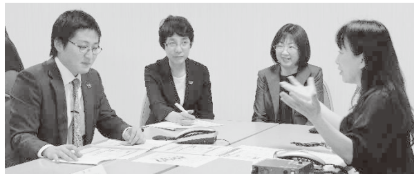
自身の対応内容の振り返りと気づきでステップアップ