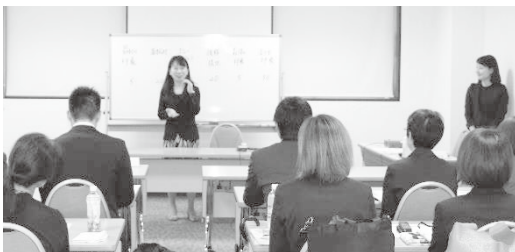
審査基準項目及び対応ポイントの解説