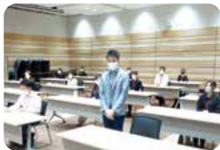
最優秀賞発表の瞬間