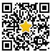
電コン★チャンネルQR

また、来年も電話対応コンクールへ参加を予定している皆さま、そして来年こそは参加してみたいと考えている企業の皆さま、全国代表の電話対応を参考にしてみませんか!?