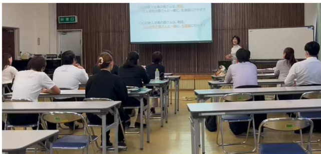
第1部のコミュニケーション講座の様子