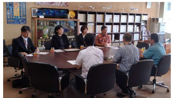
(沖縄県庁商工労働部の方へ結果報告)