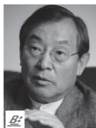
(株)ビジネス・ブレークスルー 代表取締役会長 大前 研一氏