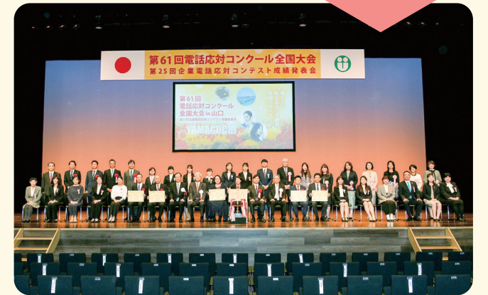
▲2022年度「電話対応コンクール 全国大会」の様子

電話対応日本一を決めるメジャーなイベントと自負しておりますが、番組タイトルの通りまだまだ知られていないのだと痛感させられ