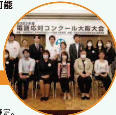
▲2023年度大阪大会表彰式の様子