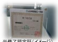
※修了認定証(イメージ)