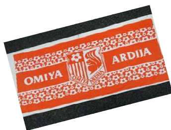
NACK5スタジアムの受付 全員にオリジナルバスタオルプレゼント。