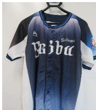
球団創設70周年アニバーサリー 『サードユニフォーム』参加者全員プレゼント