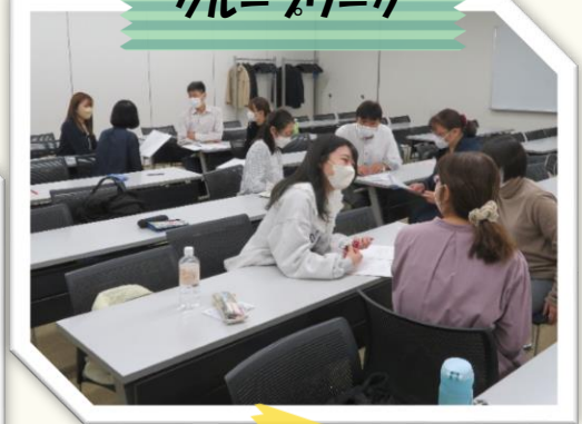
大宮・川越・越谷