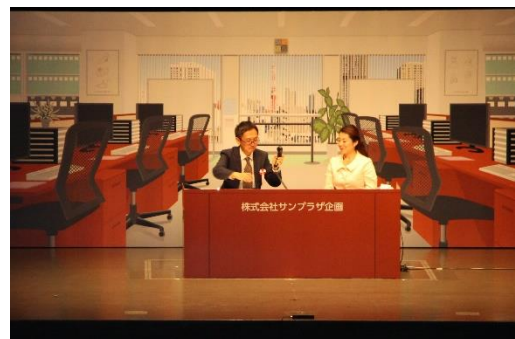
さすが滋賀県代表のお二人、素晴らしい笑顔で応対です。