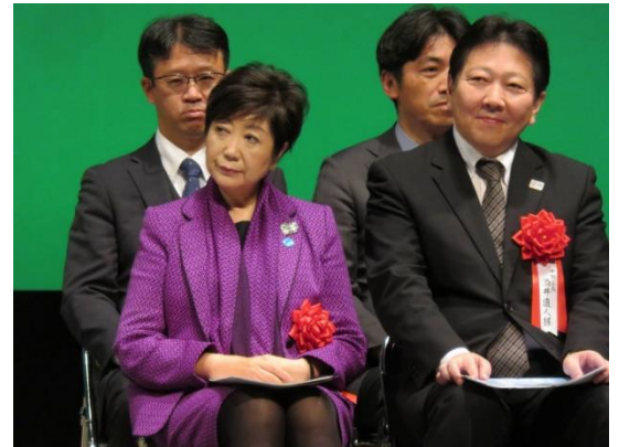
来賓には、小池東京都知事も駆けつけてくださいました。

11月22日(金)「東京 中野サンプラザ」において、第58回電話応対コンクール全国大会 in 東京が開催され、全国10,333名(延べ)の参加者の中から予選を勝ち上がられた57名の選手が出場しました。