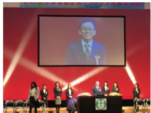
選手入場(選手あいさつ)の様様。お二人とも、笑顔で堂々として自己紹介をされました。