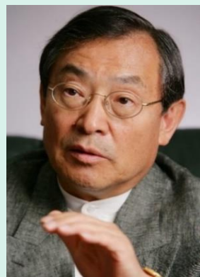
(株)ビジネス・ブレイクスルー 代表取締役会長