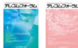
月刊誌 テレコム フォーラム