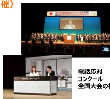
電話応対 コンクール 全国大会の様子

専門スタッフが“仮のお客様”となって、普段の応対スキルを診断し、改善のためのアドバイスを含めてレポートします。