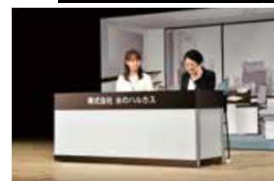
電話応対 コンクール 全国大会の様子