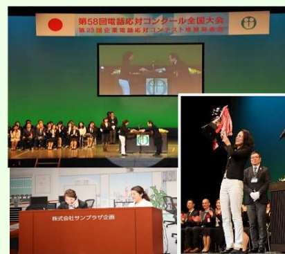
電話応対コンクール全国大会の様子

専門スタッフが”仮のお客様”となって、普段の応対スキルを診断し、改善のためのアドバイスを含めてレポートします。