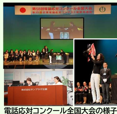
電話対応コンクール全国大会の様子

専門スタッフが”仮のお客様”となって、普段の対応スキルを診断し、改善のためのアドバイスを含めてレポートします。