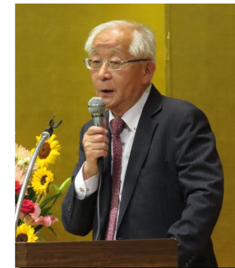
政治ジャーナリスト (駿河台大学客員教授) 田崎 史郎氏