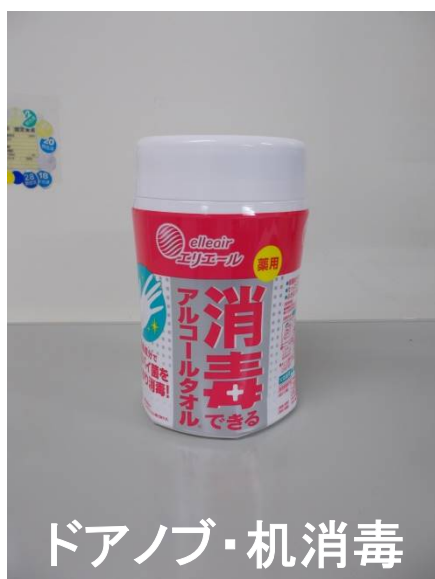
ドアノブ・机消毒