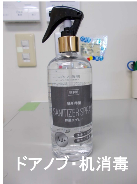
ドアノブ・机消毒