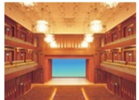
写真:福岡シンフォニーホール (全国大会開催会場)